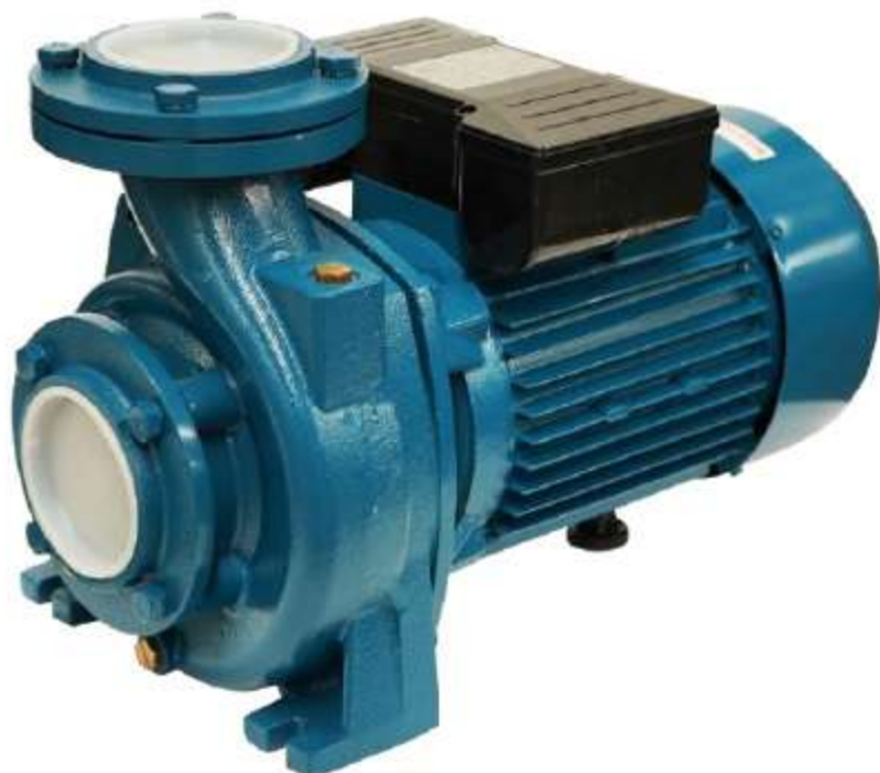
DHM (หน้าแปลน)